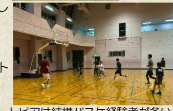
トピアは結構バスケ経験者が多い！

高性能住宅実績NO.1 アフターメンテナンスNO.1 本物の快適・安心の住まいづくり