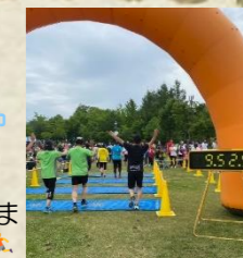
無事にゴール！ 気分爽快！

ただ、そんなもんで運動不足は解消しないので、最近バスケットボールをしています！次女がバスケ部なので一緒にしたり、先日はバスケ経験者の社員や業者さん、お客様とディスポートで2時間走ってきました！しかし最後足が撃ってゲームに出れないという情けなさ(;v;)でもめっちゃ楽しくて、不定期ですが毎月くらいで集まりたいです！チーム作りたいなあ～