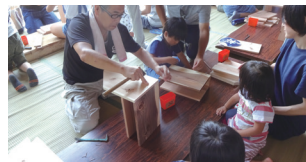
詳しくはお問い合わせください。