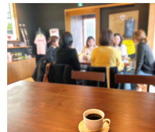
ママプロ座談会のようす

「ママプロ」は、これからもママさん達との交流を重ね、暮らしに寄り添うママ目線の住まいと一緒に考えていきます。間取りやプランについて詳しく知りたい方は、お気軽にお問い合わせ下さい。