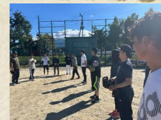
晴天の中でソフト大会は見事優勝！

健康にも、趣味としても、人との交流としても、そして地域の良さを再発見できる機会としても、四季折々のスポーツは楽しく続けたいものです！