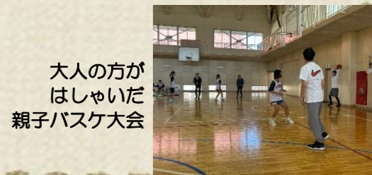
大人の方はしゃいだ親子バスケ大会

高性能住宅実績NO.1 アフターメンテナンスNO.1 本物の快適・安心の住まいづくり